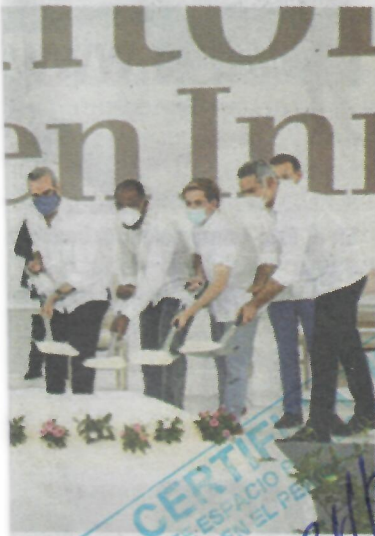
se se construirá en La Romana

económicos de un grupo de inversionistas dominicanos y extranjeros, entre los que está el jugador de Grandes Ligas Edwin Encarnación.