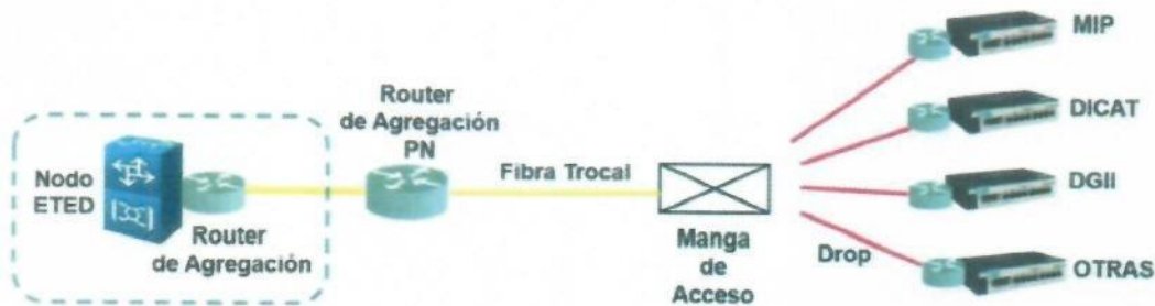
DIAGRAMA DE INTERCONEXION.