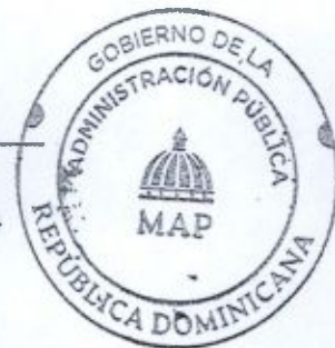
Lic. Darío Casillo Lugo Ministro de Administración Pública

Resolución núm. 269-2023, que aprueba la renovación de la Tercera Versión de la Carta Compromiso al Ciudadano de la Oficina Gubernamental de Tecnologías de la Información y Comunicación (OGTIC).